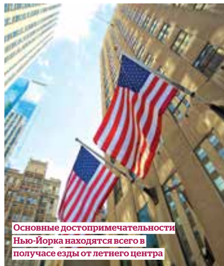
Основные достопримечательности Нью-Йорка находятся всего в получасе езды от летнего центра